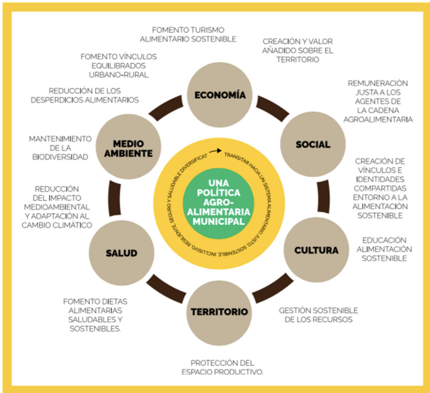
Figura 1: Estrategia Agroalimentaria València 2025